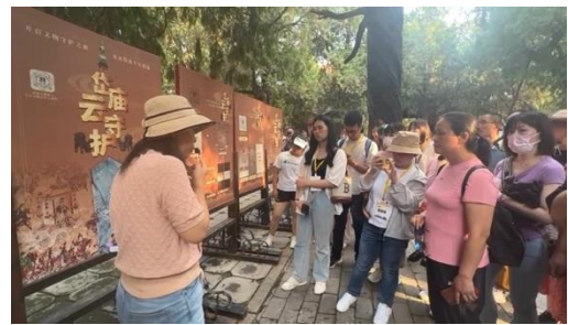
圖十二：學生參觀岱廟 聆聽解說