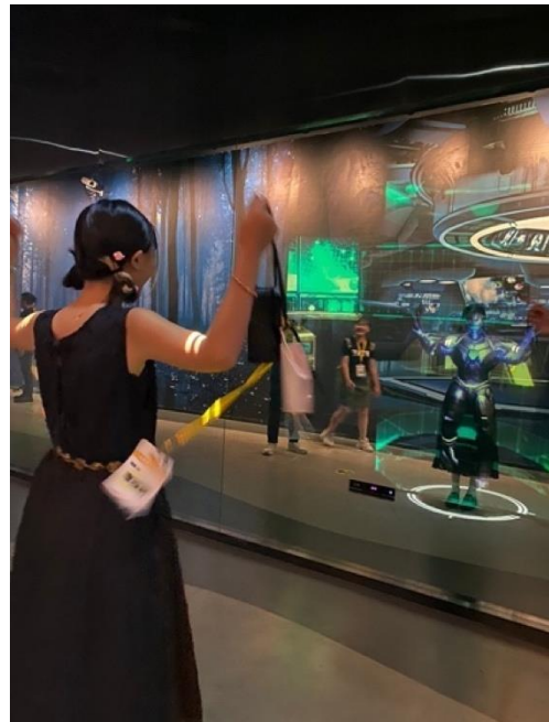
圖三十：體驗博物館中設施