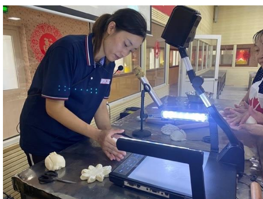
圖二十：講師示範饅頭製作技巧

說到山東，「燒餅、油條、大饅頭」絕對不會被落下，在多種麵點中，學生們體驗製作饅頭，從麵團發酵後的揉麵到饅頭塑形，將饅頭做成可愛的刺蝟、小豬等。而在製作的共乘中，也透過歷史解說讓同學了解饅頭的由來。