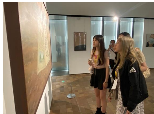
圖三二：學生細品美術館中作品