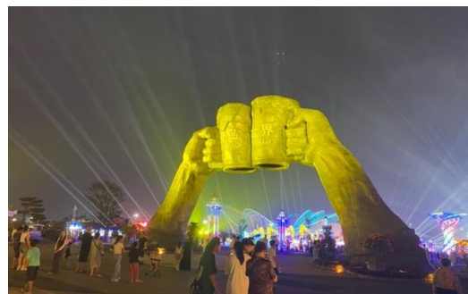
圖三六：啤酒節會場