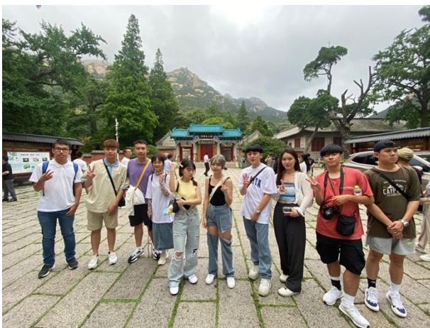
圖二五：學生於太清宮前合照