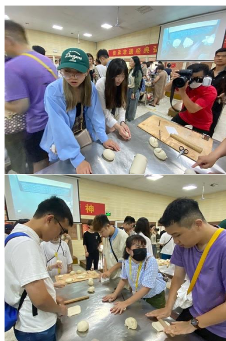
圖二一、二二：學生體驗饅頭製作