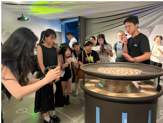
圖二九：參觀青島電影博物館 聆聽電影製作

身為傳院學子，對於藝術以及電影多少具有一定之共鳴，透過參觀電影博物館，了解電影發展之歷史，以及體驗電影製作之流程，透過參觀美術館，感受當地藝術家將生活之見聞呈現於作品當中。