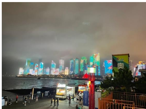
圖三三：浮山灣夜景

浮山灣邊高樓矗立，樓牆掛燈，在灣邊餐廳品嚐當地海鮮同時，欣賞遠處燈光秀，感受「好客山東」之展現。