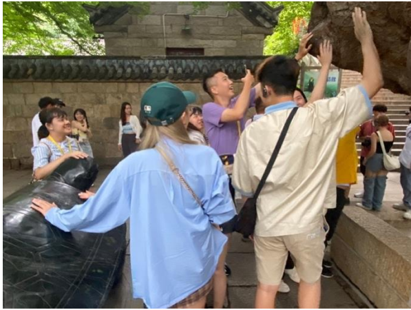
圖二七：學生摸龍頭榆與綠石龜祈求平安