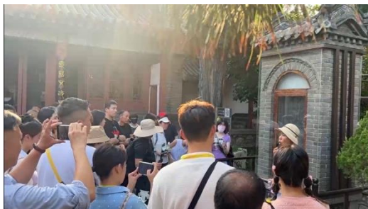
圖十一：學生聆聽此碑文之歷史意

古代皇帝登泰山前，必先前往岱廟參拜，廟中也有許多先人所留下的珍貴古物，例如秦朝李斯篆書的泰山刻石，此物之所以珍貴，是因為它代表著「秦國將天下文字統一」。透過此行之參觀以及導覽，讓學生感受到先人之傳統並且實際走訪泰山。