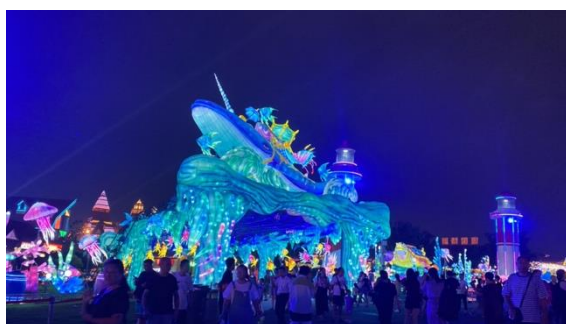
圖三五：啤酒節會場花燈

說到青島，絕對少不了啤酒，此次移地教學剛好遇上當地「青島啤酒節」，此站行程讓同學體驗青島「哈皮舅」的文化，以及感受活動之氣氛。