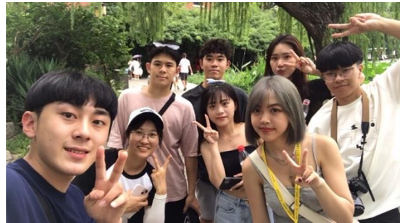
圖八：學生於趵突泉合照