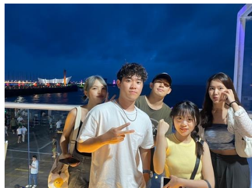
圖三四：學生於浮山灣合照