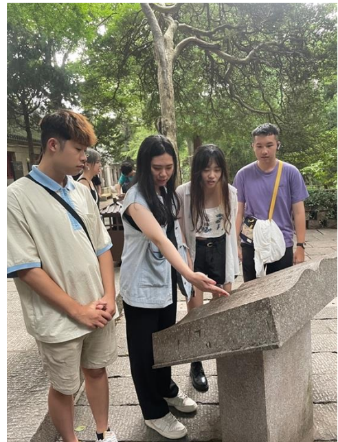
圖二六：學生討論石盤上的內容