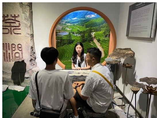
圖十九：學生模仿過去農家以茶會友之景