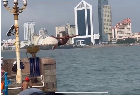
圖二：棧橋旁跳水的巧克力大叔

年代初改建時，增建橋頭的二層迴瀾閣，自此成為青島的重要景點之一，同時也是此次移地教學的第一站。