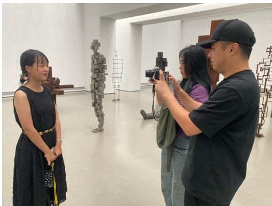
圖三一：學生向記者分享參觀美術館心得