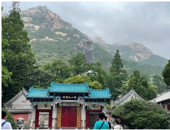
圖二四：嶗山太清宮