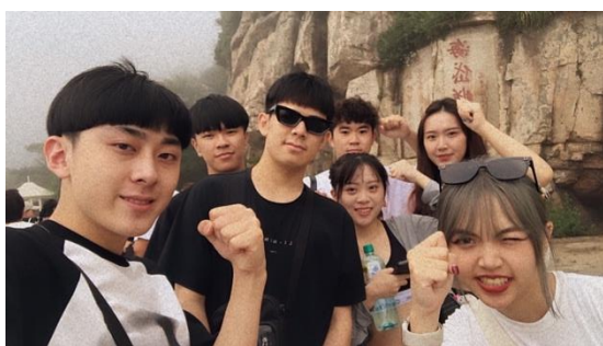
圖十三：學生登泰山合照