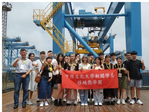
圖三八：參觀青島自動化港口