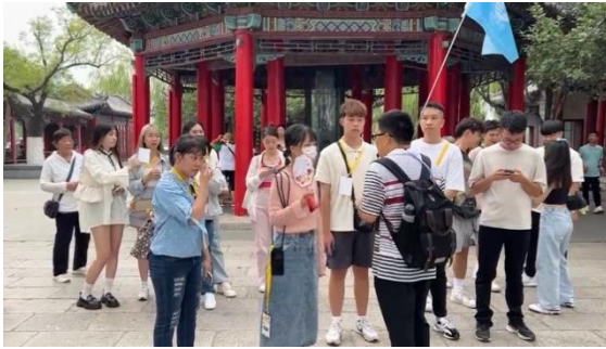
圖七：學生於大明湖聆聽解說

趵突泉以及大明湖為濟南三大名勝之二，「趵突泉」又稱「天下第一泉」，湖面清澈且呈現波光粼粼的流動感，主要是因為湖面底下一直有泉水不斷的湧出；一說到「大明湖」，便會想到過去課本中劉鶚《老殘遊記》上所描寫之景色，「四面荷花三面柳，一城山色半面湖。」。藉由此行，讓同學親眼見到書中之景。