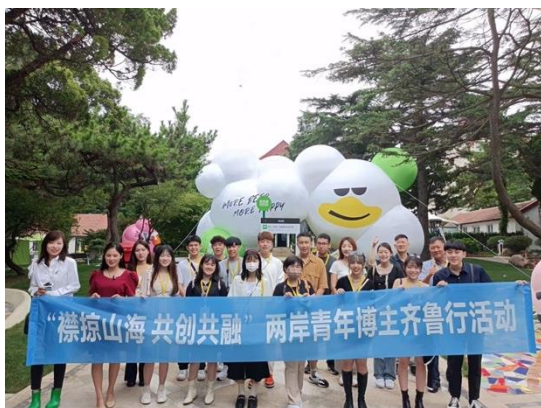
圖五：學生與博主於八大關文創商店合照