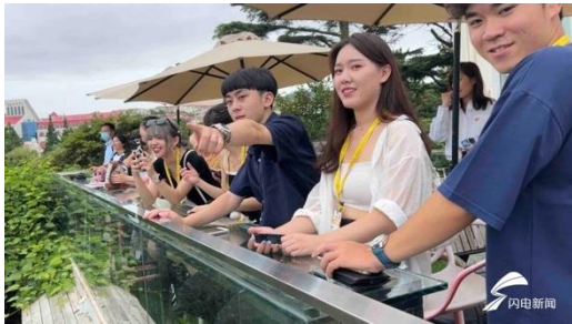
圖三：學生站在建築物頂樓欣賞海邊風景

而在導覽過程中，有同學欣賞這些建築後突然說：「如果能騎腳踏車穿梭在這些街道當中一定很舒服。」此時導遊說到：「那麼你應該會累慘，因為這裡的坡都是很陡的。」