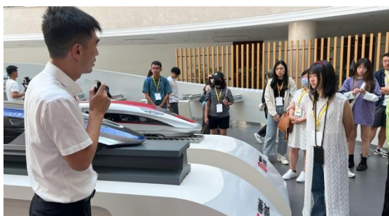
圖三七：參觀中車集團 聆聽解說

透過企業參訪，讓同學了也中國之企業發展及科技之進步。透過參觀現代化全自動化港口以及城市規劃館，了解城市以及經濟之發展。