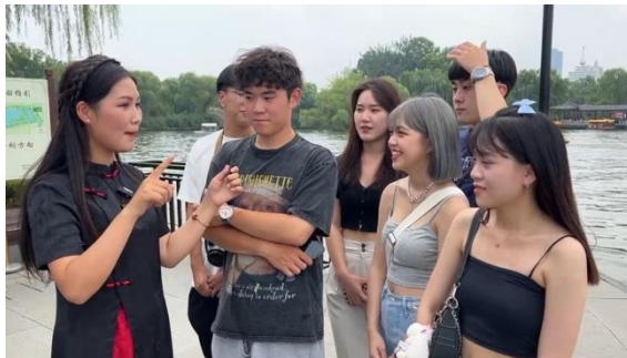
圖九：學生與博主互動交流