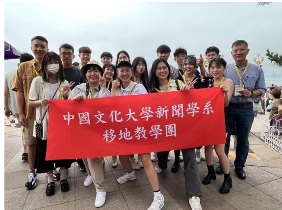
圖四：學生於棧橋旁合照