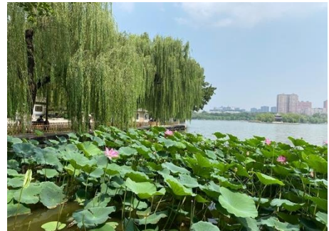
圖十：大明湖畔荷花與柳樹