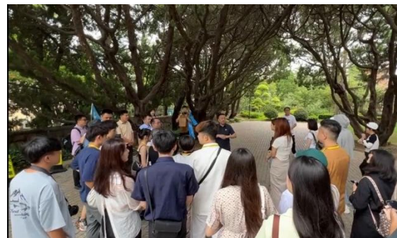
圖六：參觀宋公祠 聆聽解說