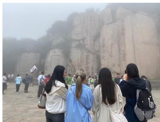
圖十四：學生記錄下泰山之景