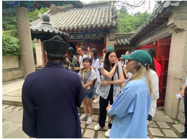
圖二八：學生聆聽道長解說