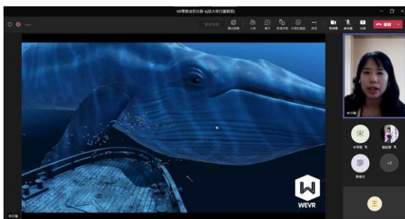
林日璇老師 VR 畫面分享